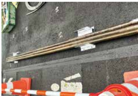
ボーリングロッド置