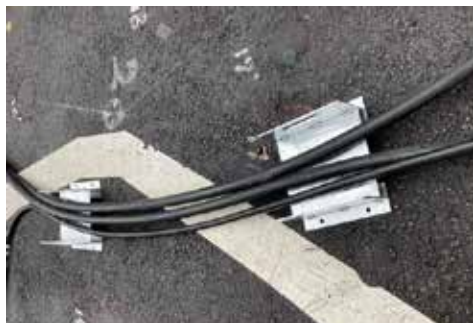
ホースラインの整理

薬液注入、アンカー、ロックボルト等の現場でのホースラインの整理 ホースライン以外にも、資材、材料の仮置き用としてもご使用下さい